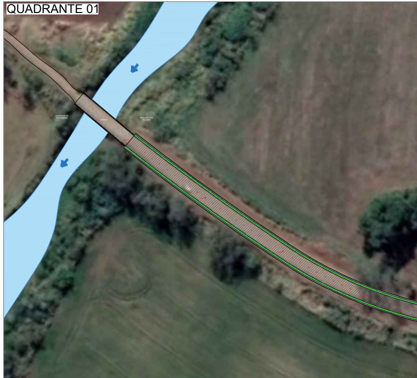
IMPLANTAÇÃO ESC. 1:2000