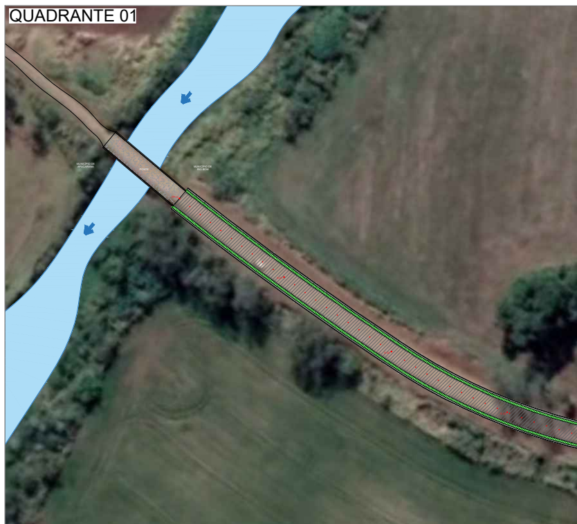
IMPLANTAÇÃO ESC. 1:2000