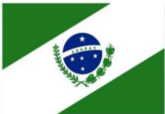
Brasão do Paraná